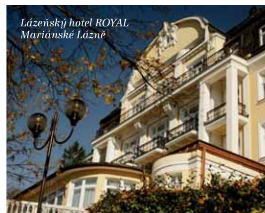
Lázeňský hotel ROYAL Mariánské Lázně

a dolních cest dýchacích, trávicího ústrojí, poruch výměny látkové a žláz s vnitřní sekrecí (diabetes, obezita), onemocnění pohybového ústrojí, periferních cév a nervů a onkologických nemocí v remisi. Lázeňské hotely Miramare mají 215 lůžek a k léčbě využívají dva vlastní léčebné prameny. V zimních měsících proběhla rekonstrukce balneoprovozu v budově Miramare II. S novými speciálními vanami, obklady